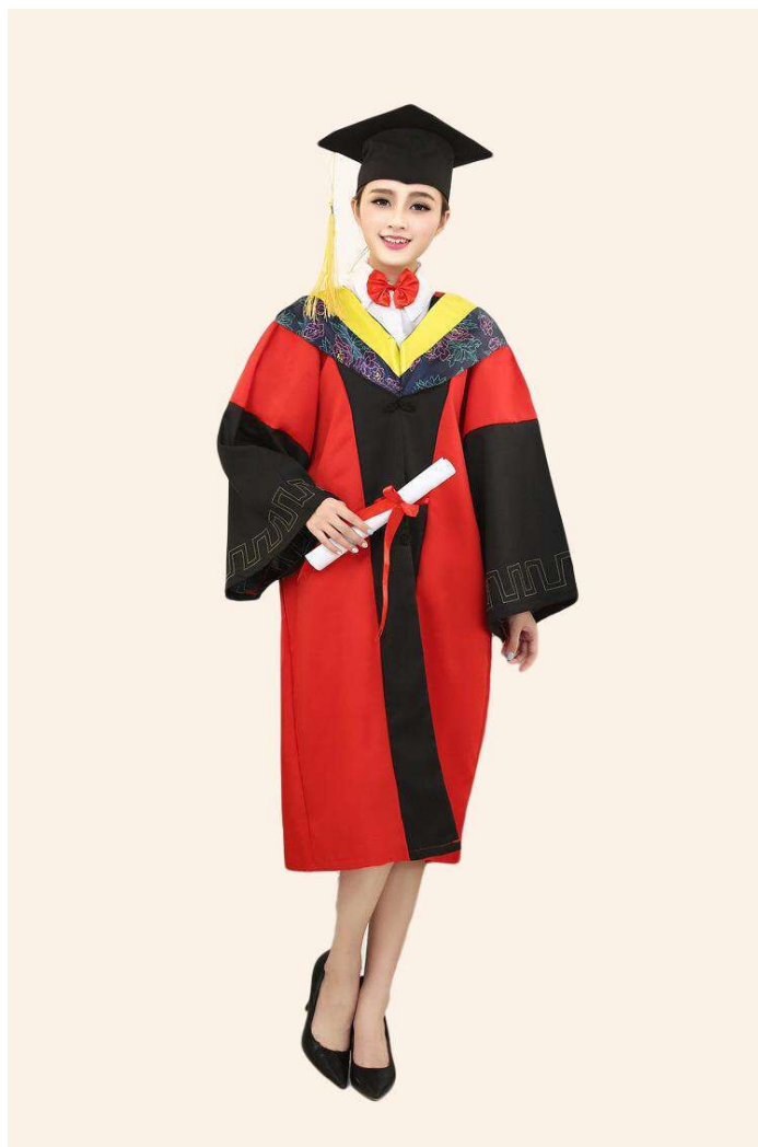
博士学位服穿着示意图

● 内衣：应着白或浅色衬衫。男士系领带，女士可扎领结。 ● 裤子：男士着深色裤子，女士着深色裤子或深、素色裙子。 ● 鞋子：应着深色皮鞋。